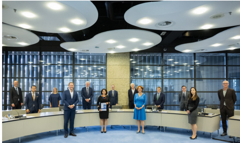
Tijdelijke commissie Digitale Toekomst